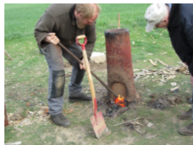
7. Der kommer stadig slagge og trækul ud af ovnen før jernklumpen viser sig