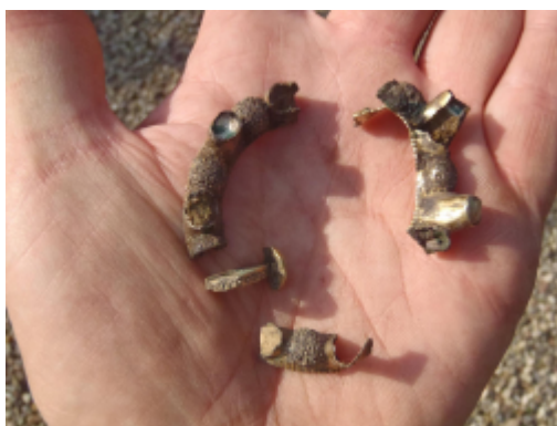
Ringspænderne, som lå sammen med mønterne fra Dalby.

menter af to forgyldte ringspænder af sølv. Det ene oven i købet med små "tårne", hvor der på toppen er indlagt en lille halvædelsten. Skal man være helt ærlig, er mønterne ikke noget at råbe højt hurra for! Sølle 158 er vi oppe på nu – og det er faktisk ikke ret meget for en skat fra den urolige tid i slutningen af 1200 og begyndelsen af 1300-årene. Mønternes sølvindhold var gennem nogle årtier blevet gradvist reduceret til stort set ingenting og den enkelte mønt regnedes derfor ikke for ret meget. I en række andre fynske skattefund ses mange flere mønt-