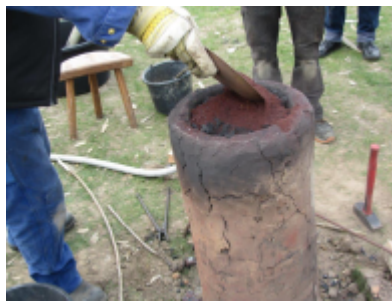
5. Udgravningen af jernklumpen kan påbegyndes