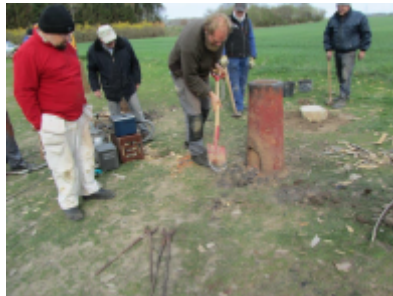
6. Lerpladen slås i stykker for at give plads til, at jernklumpen kan tages ud. Ifølge smeden, er det ikke så underligt, at man ikke finder de oprindelige plader på oldtidens produktionssteder