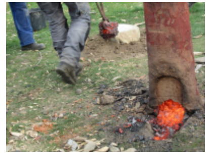
9. Der bliver straks slået på lubben for at fjerne den sidste slagge