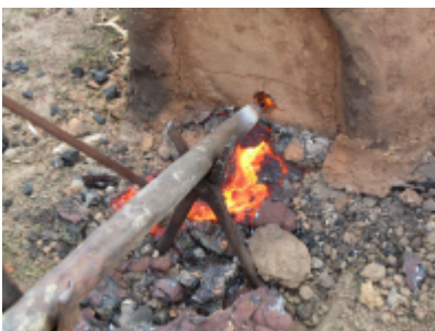
4. Glødende slagge løber ud. Brændingen går bedst, når slaggen har konsistens som piskefløde. Der blæses luft ind i ovnen for at regulere forbrændingen