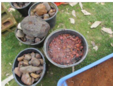
3. Undervejs i udvindingsprocessen hældes skiftevis myremalm og trækul i ovnen.