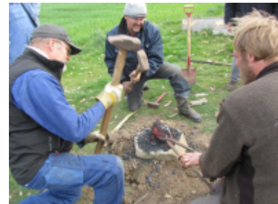
10. Der var små stykker jern blandt slaggeresterne