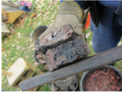
2. Forskellige typer af myremalm. De store stykker ristes på bål for at gøre dem porøse. Det gør det lettere at knuse dem inden brændingen