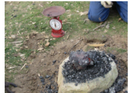
11. Der blev udvundet omkring 3 kg jern af 25-30 kg malm i 2 ovne. Et godt udbytte. I smedens esse viser kvaliteten sig dog ikke at være så god