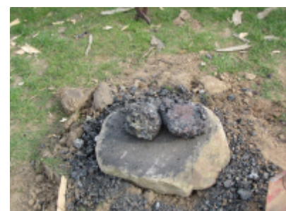
12. Lubbe med stort jernindhold fra en tidligere brænding