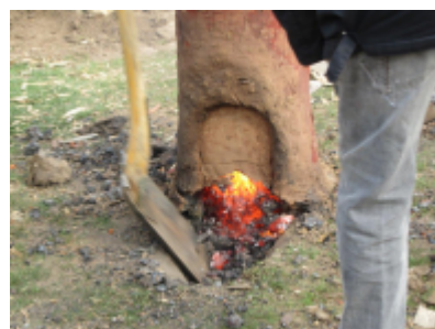
8. Endelig er den fri og må bæres væk med en stor tang